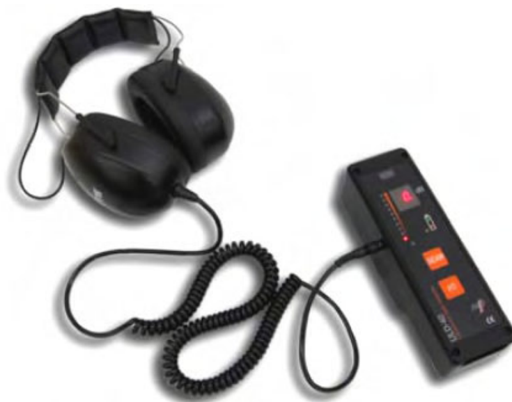
[ULD 40 Detalle auriculares]