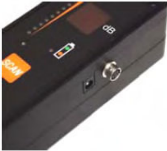
[ULD 40 detalle entrada/salida]