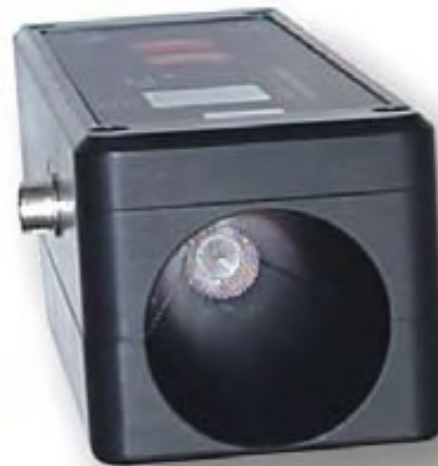
[ULD 40 detalle sensor ultrasónico]