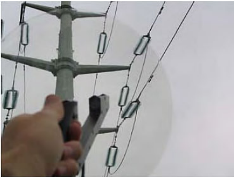
[ULD 40 uso en redes aéreas de alta tensión]