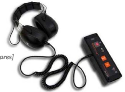
[PULD 40 Detalle auriculares]