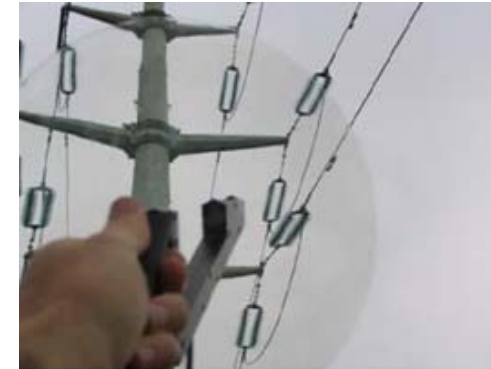
[PULD 40 uso en redes aéreas de alta tensión]