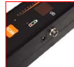
[PULD 40 detalle entrada/salida]