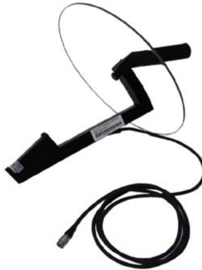
PULD 40 - Detalle antena parabólica