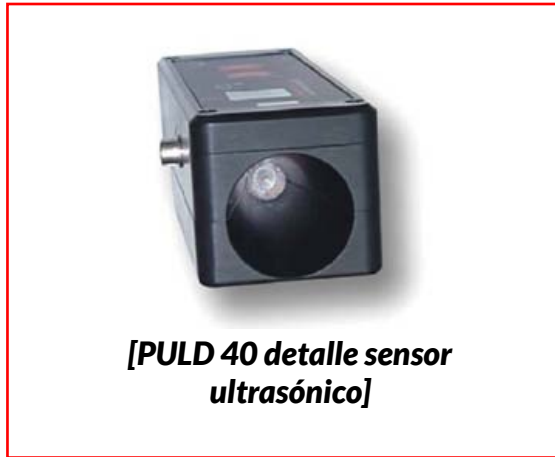
[PULD 40 detalle sensor ultrasónico]

Los defectos de aislamiento representan un factor de degradación, de pérdida de energía y de reducción del tiempo de vida de la red eléctrica. Hoy en día, es primordial tener los equipos adecuados para reducir su costo de explotación y ahorrar tiempo. El PULD-40 permite realizar inspecciones acústicas muy precisas y con seguridad. Este equipo es tan fácil de usar que no requiere formación continua de los operadores. Una de las ventajas del PULD-40 es que puede ser utilizado en un ambiente ruidoso, como es el caso de las industrias. Además, el equipo puede servir para muchas aplicaciones, el cuál es universal e indispensable.