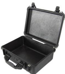
Maleta de plástico para cables