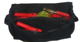
Bolsa para cables