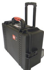
Maleta de plástico para cables con ruedas