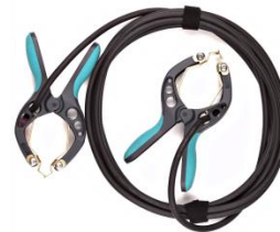
Cable de conexión de corriente con pinzas TTA