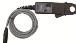
Pinza de corriente 30/300 A con extensión de 5 m