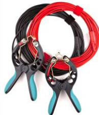
Cables de tensión con pinzas TTA