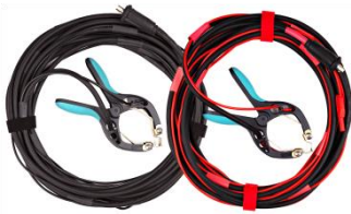
Cables de corriente y tensión con pinzas TTA

Todas estas especificaciones son válidas para una temperatura ambiente de +25 °C y con los accesorios recomendados. Las especificaciones están sujetas a cambio sin previo aviso. Las especificaciones son válidas si el equipo se utiliza con el conjunto de accesorios recomendado.